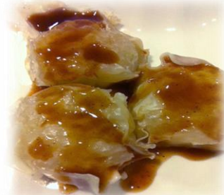
片栗粉と玉ねぎだけで作ったシュウマイソースでどうぞ!!